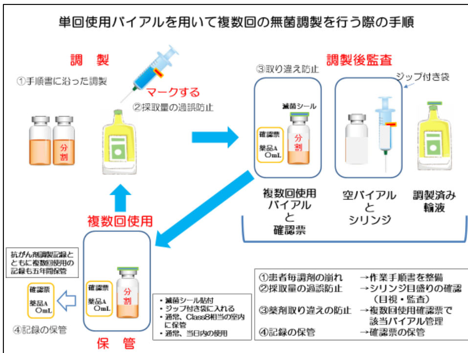
図 2 安全な無菌調製を確保するために最低限必要な手順(例示)