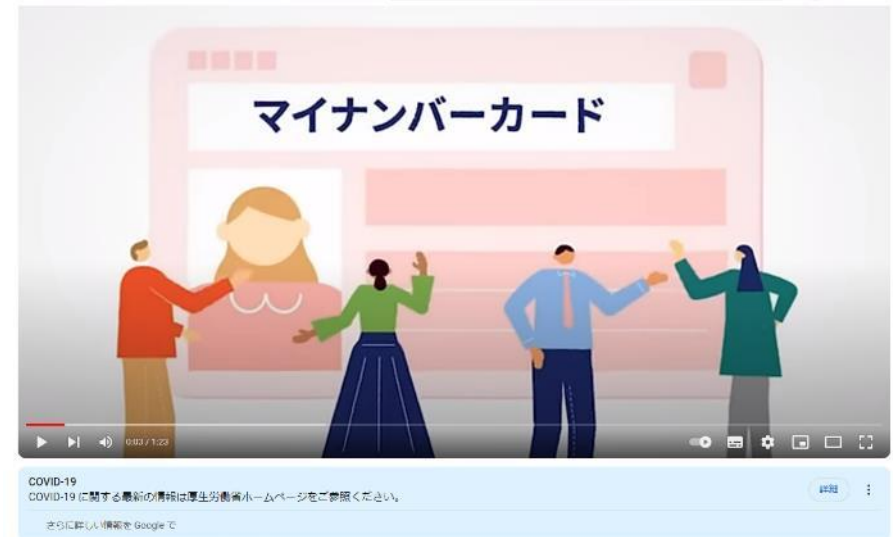
マイナンバーカード「いま」と「これから」

マイナンバーカード「いま」と「これから」 (youtube.com) https://www.youtube.com/watch?v=N2HIIPjnobY