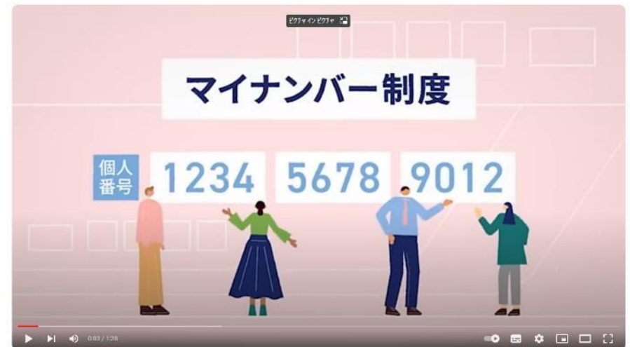
マイナンバー 制度「報告」と「対策」

マイナンバー 制度「報告」と「対策」 (youtube.com) https://www.youtube.com/watch?v=cPGselFiWxc