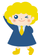
パートタイム・有期雇用労働法 キャラクター「ハゆう」ちゃん