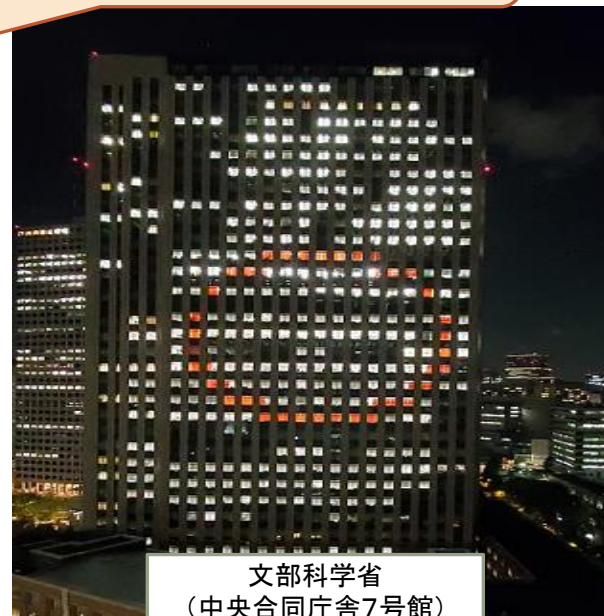
文部科学省 (中央合同庁舎7号館)