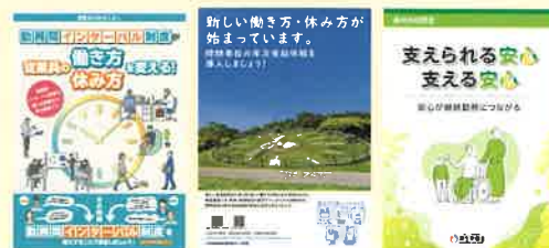
各制度に関するリーフレット(例)

「勤務間インターバル制度」「時間単位の年次有給休暇制度」「特別な休暇制度」などについて、企業の取組事例の紹介や、リーフレットなどの資料を掲載しています。自社における制度検討の参考にご活用ください。