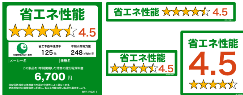
(冷蔵庫のイメージ)