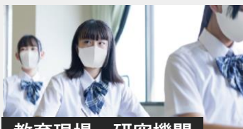
教育現場・研究機関

お客様訪問がある接客クルーやどうしても出社せざるを得ない職場でも、安心して働けることを目指します。