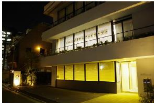
日本理学療法士協会ビル（東京都港区）の オレンジライトアップ