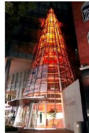
日本看護協会ビルの オレンジライトアップ