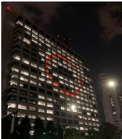
総務省、警察庁、国土交通省 (中央合同庁舎2号館)