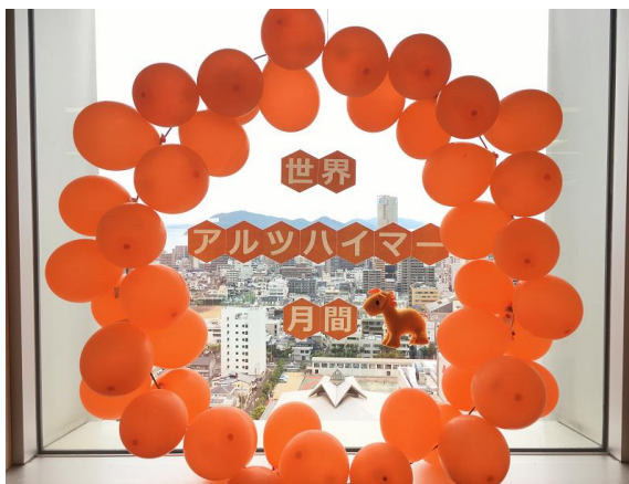
香川県庁オレンジドレスアップ (香川県)