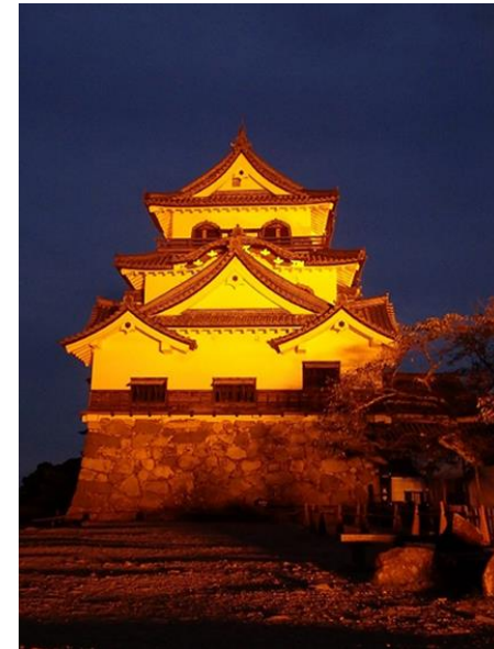
彦根城 (滋賀県彦根市)