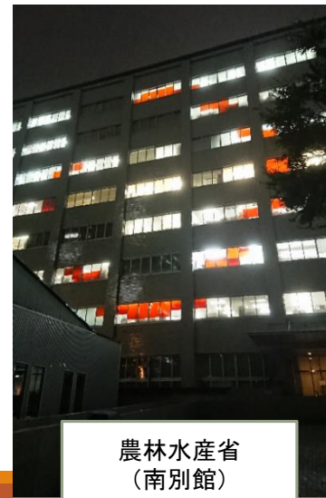
農林水産省 (南別館)