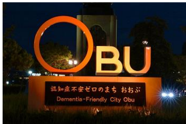
オレンジリングモニュメント (愛知県大府市)