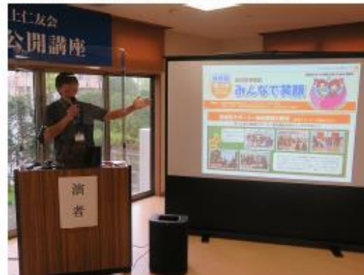
認知症の普及啓発イベント実施