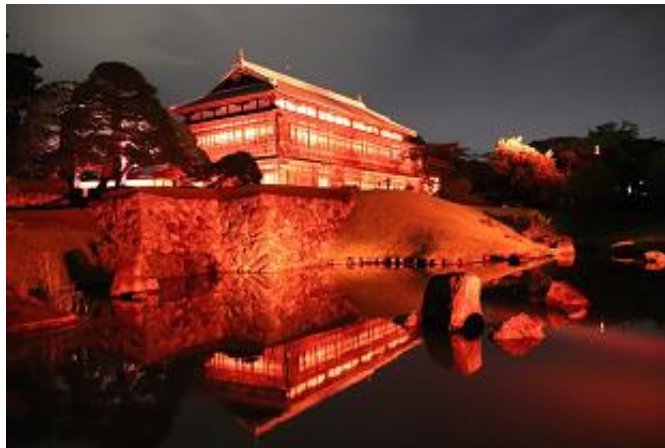
臨江閣 (群馬県前橋市)