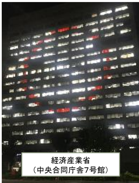
経済産業省 (中央合同庁舎7号館)