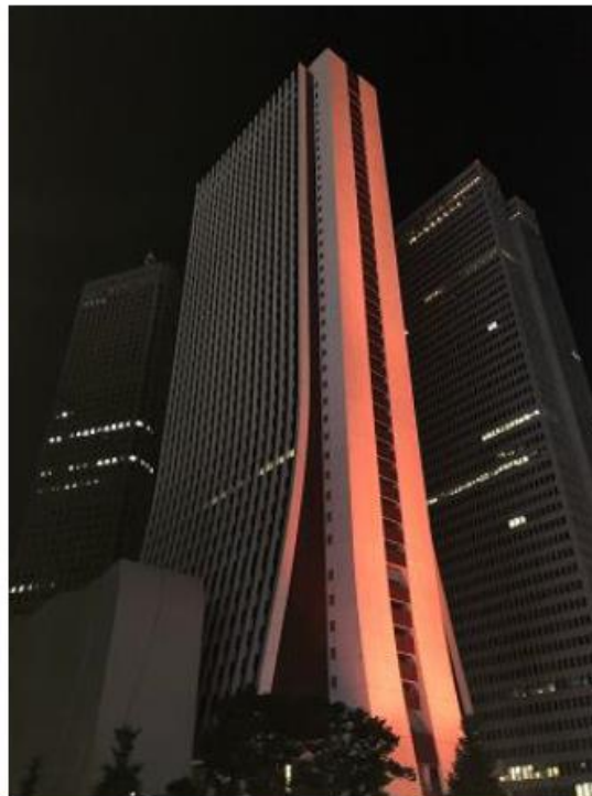
損保ジャパン本社ビル（東京都新宿区）の オレンジライトアップ