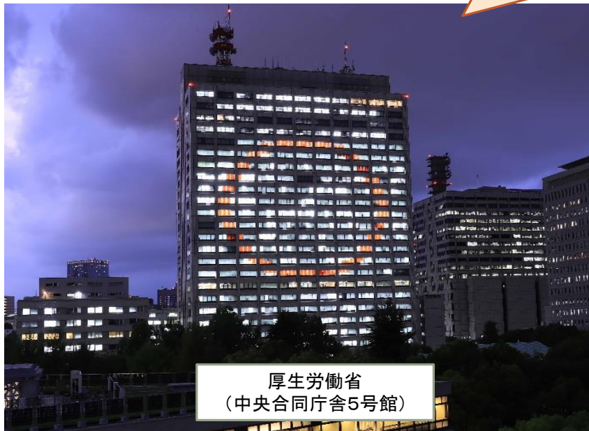
厚生労働省 (中央合同庁舎5号館)