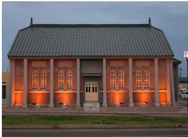
旧制木造中学校 (青森県つがる市)