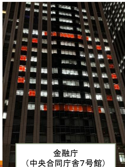
金融庁 (中央合同庁舎7号館)