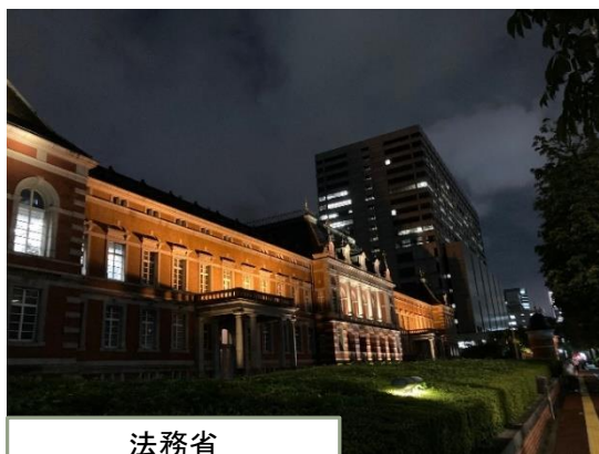
法務省 (旧本館(赤れんが棟))