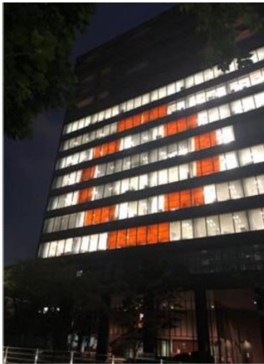
東京海上日動三番町ビル（東京都千代田区） のオレンジリングドレスアップ