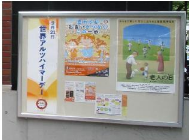
日本看護協会ビル（東京都渋谷区）前への ポスター・リーフレット掲示