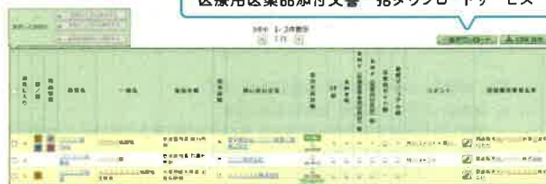
「マイ医薬品集作成サービス」作成画面サンプル(登録医薬品一覧)