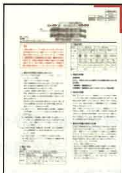
PMDAホームページ上の 最新の電子化された 添付文書を表示