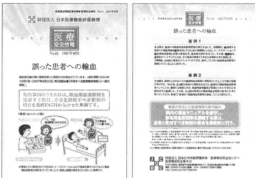
図表Ⅲ-3-14 医療安全情報No.11「誤った患者への輸血」