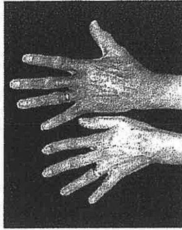
輸血後鉄過剰症の診療ガイド から引用