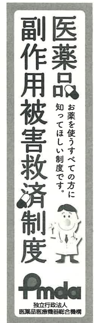
⑤ワイドサイズスクレイバー / 左右 160pix × 天地 600pix