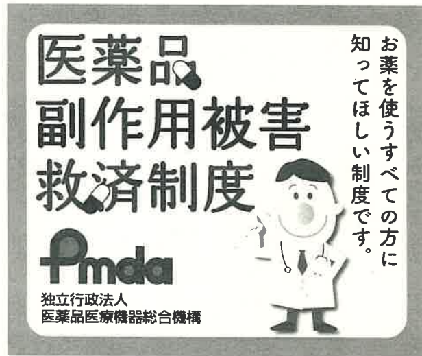
①レクタングル (大) / 左右 336pix × 天地 280pix