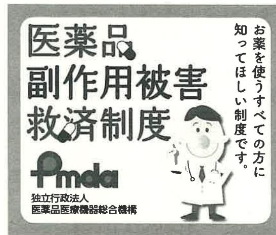
②レクタングル / 左右 300pix × 天地 250pix