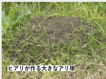
ヒアリが作る大きなアリ塚

これまで存在していなかった危険な毒アリが国内で現れています。 もし発見しても、 決して触らないでください！