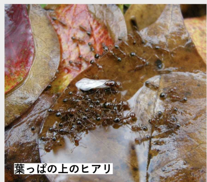
葉っぱの上のヒアリ