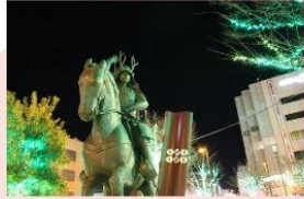
上田駅前の真田幸村像