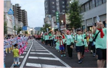
上田わっしょい (7月)